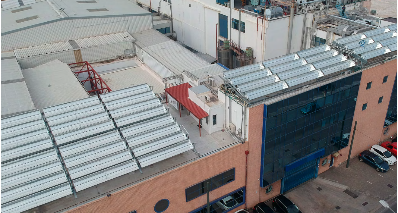
Installationen på Colgate-Palmolives fabrik i centrala Aten syns på långt håll. Hettan som genereras i solfångarna används för att tillverka hushållskemikalier.