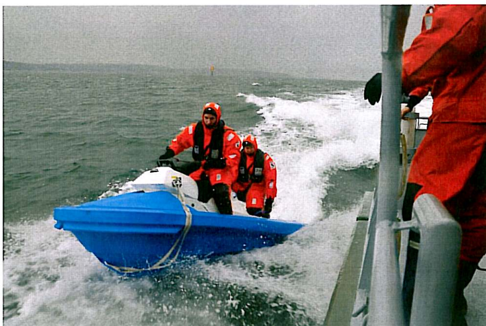
Finska Gränsbevakningsväsendet övar bordning med Rescuerunner utanför Åbo