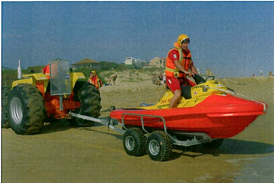
Sjösättning av Rescuerunner från Wilderness Rescue Station i Sydafrika