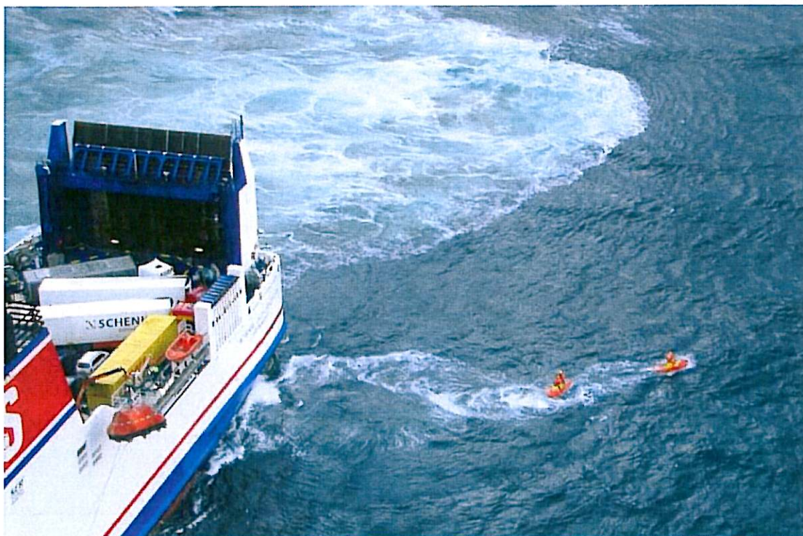
Rescuerunners har bogserat fram en räddningsflotte till Stena Jutlandica som håller på att lyftas ombord.

Transportstyrelsen Fartygstekniska enhet (tidigare Sjöfartsverket) bjöd in FIRST-projektet till International Maritime Organizations (IMO) huvudkontor i London för att presentera konceptet där Rescuerunner och RRC är nyckelkomponenter. *IMO är FN:s organ för maritima frågor och IMO ansvarar för alla internationella regelverk som rör sjöfart. Därför var det ett stort genombrott att projektet presenterades för IMO.