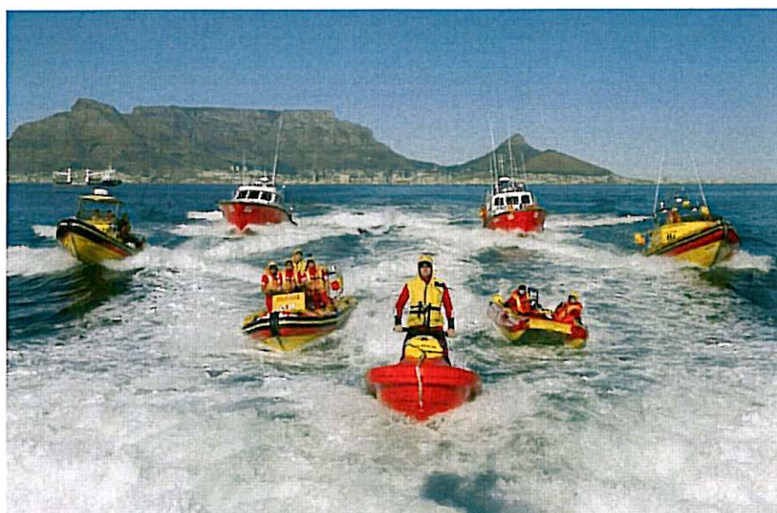
Delar av sydafrikanska National Sea Rescue Institutes räddningsflotta utanför Kapstaden.