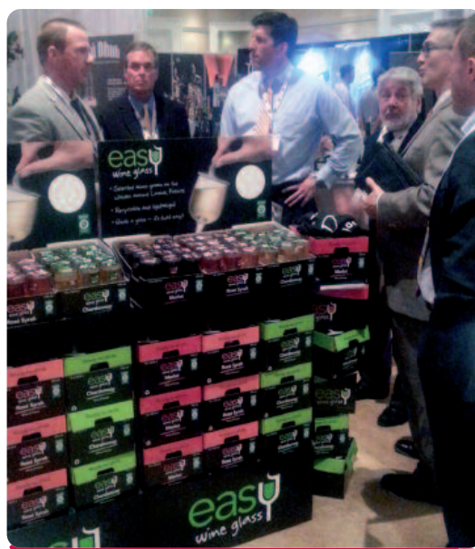
Easy Wine Glass produkter har under 2013 visats upp på ett antal mässor i USA, bl.a. på Wine & Spirits Wholesalers of America's '70th Annual Convention & Expo' i Orlando, Florida.