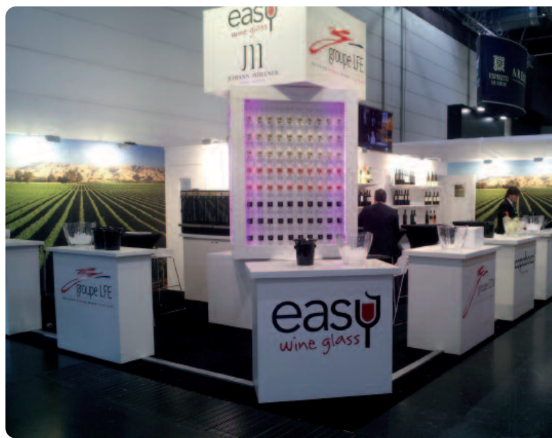
Cefours produkter visades upp i Groupe LFE:s monter på Pro Wein-mässan i Düsseldorf i mars 2013.

Namnet Easy Wine Glass är varumärkesskyddat och designen på glaset har beviljats mönsterskydd.