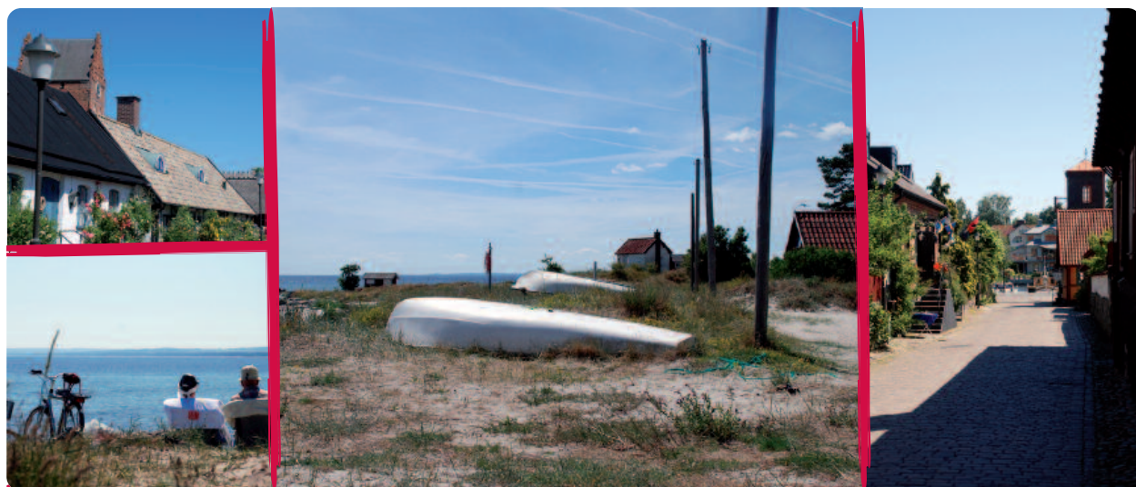
Cefour har sin bas i Åhus på den sydsvenska ostkusten

Marknadsinsatserna har i huvudsak varit riktade mot Skandinavien och Västeuropa och på senare tid även mot den amerikanska marknaden. Kostnaderna för marknadsinsatserna har främst finansierats genom ett antal emissionserbjudanden.