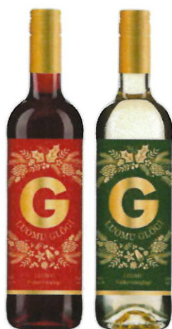
G-glögi röd- och vitvinsglögg