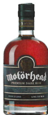
Motörhead Premium Dark Rum