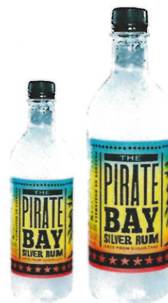
Pirate Bay silver rum 0,35 / 0,7