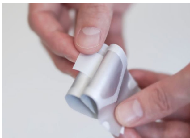
Zeqmelit ® kan via sin lilla storlek alltid bäras med av patienten i till exempel plånbok eller bakom ett mobiltelefonskal.

Zeqmelit ® är en tunn munfilm som innehåller dexametason. Filmen löses på 10–15 sekunder upp på tungan med hjälp av saliv och ställer inga krav på att patienten har tillgång till vatten. Läkemedlets administrationsform gör det till ett lättillgängligt alternativ vid akut eller svår allergi. Dexametason är en väldokumenterad och välanvänd glukokortikoid, en antiinflammatorisk substans, och finns i flertalet beredningsformer. Zeqmelit ® munfilm är en ny och användarvänlig administrationsform. Zeqmelit ® riktar sig främst mot patienter med svåra och akuta allergiska reaktioner med krav